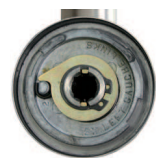
Drücker-Powerpaket fest/drehbar gelagert